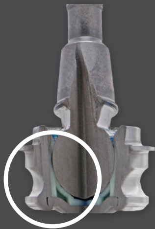
JOINT À ROTULE DU FEO Palier en polymère avec conception hermétique