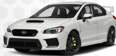
Berlines, familiales et VUS Subaru 1989-2020